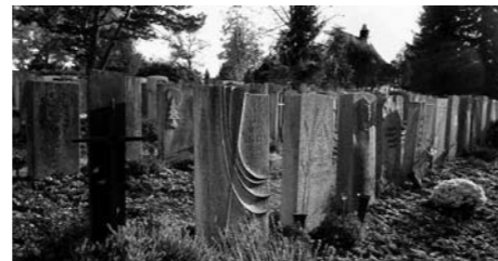
Urnengräber «Chehr» >

Ausser bei Familien-Erdbestattungsgräbern und Familien-Urnengräbern werden die Gräber der Reihe nach belegt. Persönliche Gräber (Nummer 3 bis 7) können mit einem Grabmal versehen werden. Dabei sind die vorgeschriebenen Dimensionen zu beachten. Den Zeitpunkt für das Versetzen des Grabmals bestimmt die Friedhofverwaltung. Wir sind bestrebt, den Friedhof laufend zu verschönern. Daher sind wir Ihnen dankbar, wenn Sie mithelfen, den Verstorbenen einen würdigen Platz zu bereiten. So soll bei der Materialisierung des Grabmales darauf geachtet werden, dass es sich ruhig in das Gesamtbild einordnet.