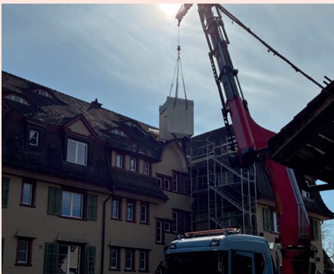
Der Lift im Wohnheim Kreuzstrasse wurde in einem Nachmittag eingebaut.

Auf der Baustelle des Wohnheims Kreuzstrasse konnte nebst den haustechnischen Installationen auch der Liftschacht termingerecht unter Dach und Fach gebracht werden. Dank dem hohen Vorfertigungsgrad der einzelnen Liftschacht-Elemente konnte der gesamte Liftschacht innerhalb eines Nachmittages montiert werden. Der neu zur Verfügung stehende Personenlift unterstützt den Warenumschlag des Grossküchenbetriebs sowie der Hauswartung und ermöglicht einen barrierefreien Zugang zu sämtlichen Geschossen.